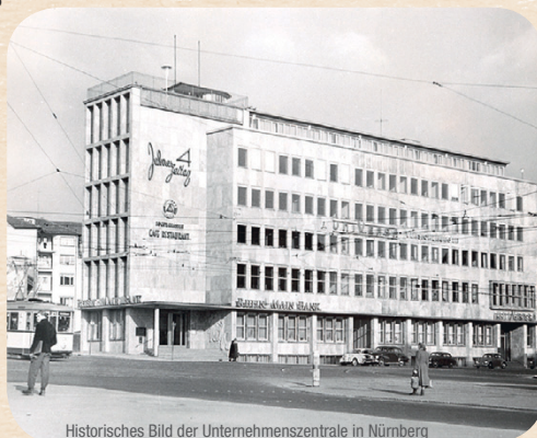
Historisches Bild der Unternehmenszentrale in Nürnberg

GESUNDHEIT: Die uniVersa feiert in diesem Jahr ihr 175-jähriges Jubiläum. Die älteste private Krankenversicherung Deutschlands wurde am 5. März 1843 als Unterstützungskasse für Tabakfabrikarbeiter in Nürnberg gegründet. Kern des Versicherungsschutzes war damals der reine Ersatz des Lohnausfalls, den der einzelne Fabrikarbeiter selbst nicht tragen konnte. Im Jahr 1934 kam die Versicherung der Behandlungs- und Heilungskosten hinzu. Heute ist die Krankenversicherung mit 567,6 Millionen Euro Beitragseinnahmen und rund 500.000 versicherten Mitgliedern das Flaggschiff der uniVersa Versicherungsunternehmen. Geblieben ist von Gründungsbeinen an die Unabhängigkeit und Philosophie als Versicherungsverein auf Gegenseitigkeit. Im Ge-